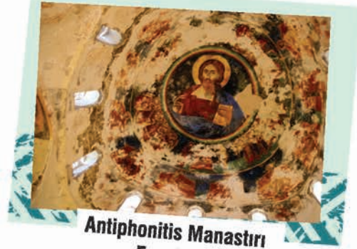
Antiphonitis Manastırı Esentepe