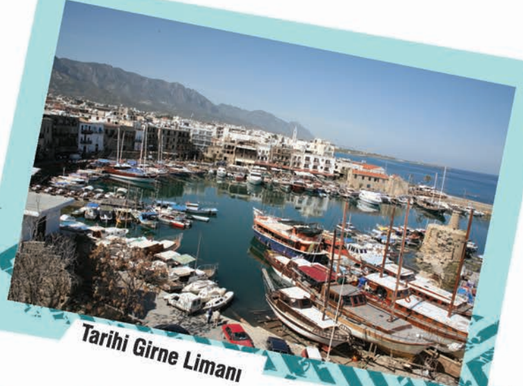
Tarihi Girne Limanı

Girne, tarihi kalesi ve limanı, gotik mimari sanatının eşsiz örneği Bellapais Manastırı, turistik konaklama tesisleri ve diğer çekici özellikleriyle Kuzey Kıbrıs turizminin en yoğun yaşandığı yerdir. M.S. XII. yüzyıl başlarında Beşparmak Dağlarının eteklerinde inşa edilen Bellapais Manastırı, Gotik mimari tarzın Doğu Akdeniz'deki en güzel örneklerinden biridir. Bellapais Manastırı'nın yer aldığı Bellapais Köyü ayrıca 1950'li yıllarda yazılan 'Acı Limonlar' kitabının ünlü İngiliz yazarı Laurence Durrell'in evinin bulunduğu yerdir.