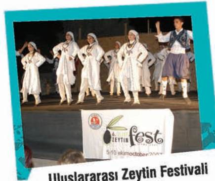
Uluslararası Zeytin Festivali Zeytinlik Köyü