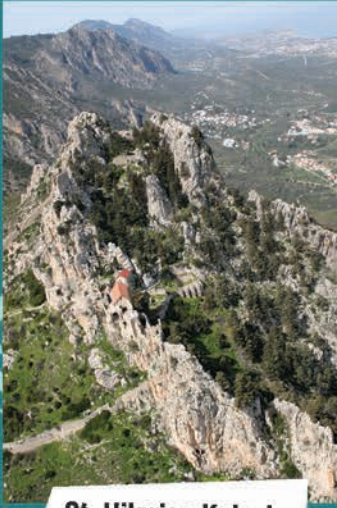
St. Hilarion Kalesi