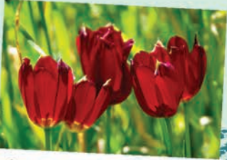
Medoş Lalesi (Tulipa cypria)