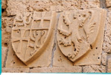
Lüzinyan Armaları - Girne Kalesi